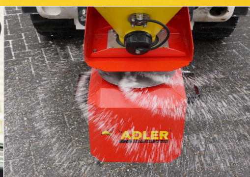
12-Volt-Getriebemotor für den Streuteller