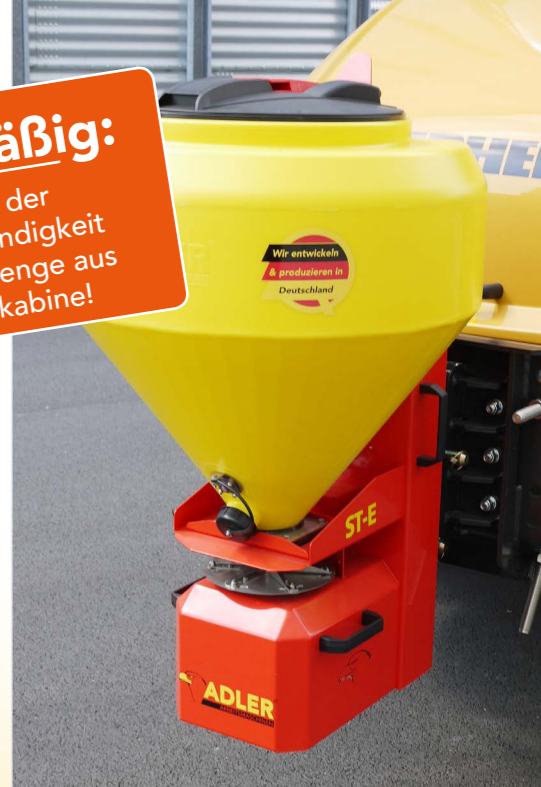
Salzstreuer im Hof-/Radladeranbau

Serienmäßig: Regelung der Drehgeschwindigkeit & Ausbringungsmenge aus der Fahrerkabine!