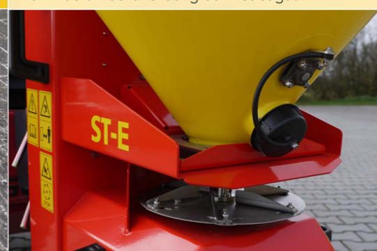
Streuweiten bis zu 6 m, regelbar über die Drehzahl