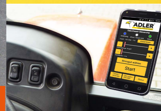
Drehgeschwindigkeit und Ausbringungsmenge werden bequem per Smartphone aus der Fahrerkabine eingestellt