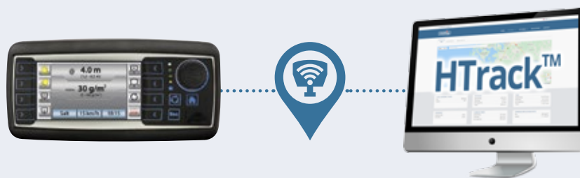
Das optionale HTrack™-Programm überträgt Streuer-Daten über das Mobilfunknetz

Mit der Tracking-Software können Sie alle Ihre Streuer und Schneepflüge online auf Ihrem Computer, Tablet oder Smartphone verfolgen und steuern. Das Programm zeigt die Bearbeitungsrouten auf der Karte an und solche Streu-Details wie Geschwindigkeit, GPS-Position, verwendetes Material, etc. Mit HTrack™ behalten Sie den Überblick über Ihre Kosten und verfügen so über den Nachweis Ihrer erbrachten Leistungen. Die Streudaten können zusammengefasst und in einem PDF-Bericht dargestellt werden.