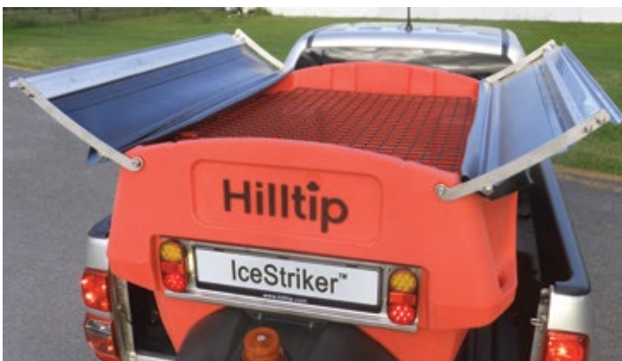
Zweiteiligen Planenmechanismus und Gitter