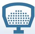
STANDARD Salz & Sand

Unser Streuer ist entsprechend den Bedürfnissen von Nutzfahrzeugen und kleinen europäischen Pickups gebaut. Der leichte Streugutbehälter aus Polyethylen bietet Ihnen zusammen mit den Baugruppen aus Edelstahl einen langlebigen Schutz vor Korrosion und Rost. Zusätzlich bietet dieses einzigartige All-in-One Streuer integrierte Tanks für das optionale Flüssigkeitssystem.