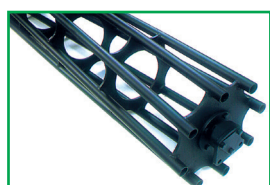
Rullo gabbia - Cage roller Rouleau cage - Stabwalze

potenza massima: 80 HP (59 KW) maximum horse power: 80 HP (59 KW) puissance maximum: 80 CV (59 KW) max. zul. Schlepperleistung: 80 PS (59 KW)