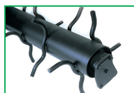
Rullo spuntoni - Spikes roller Rouleau pointes - Stachelwalze