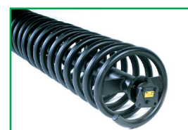
Rullo spirale - Spiral roller Rouleau spirales - Spiralwalze