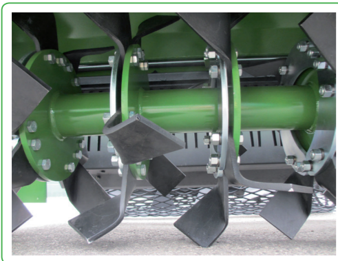
Zappe interrasassi 6 per flangia con controflangia Stone burrier blades 6 each flange with counterflange Lames enfouisseur 6 pour bride avec contre-bride Messer Umkehrfräse 6 pro Messerträger mit Gegenmesserträger