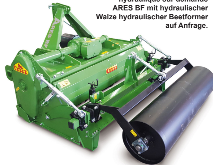
ARES BF con rullo cilindrico baulatore idraulico a richiesta ARES BF with hydraulic roller hydraulic bed former on demand ARES BF avec rouleau hydraulique butteuse hydraulique sur demande ARES BF mit hydraulischer Walze hydraulischer Beetformer auf Anfrage.