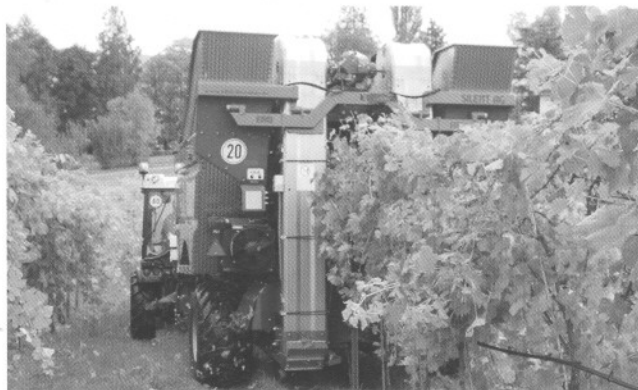
Vollernter bei der Arbeit im Rebberg.

Auf der Halbinsel Au hat man im Jahr 2002 eine Pilotanlage für den Minimalschnitt mit den Sorten Regent und Müller-Thurgau als Junganlage gestartet. Die Erziehung der Reben erfolgt nach dem Heckenprinzip. Die Jahrestriebe wachsen frei hängend, während sich im Inneren des Stockes eine Verkahlung einstellt. Dadurch entsteht eine relativ lockere Laubwand. «Während früher pro Hektar rund 700 Arbeitsstunden, wovon 180 für die Traubenlese, nötig waren, sind dies im Minimalschnittsystem lediglich 60 Stunden und davon 5 fürs Ernten», so Andrin Schifferli, Betriebsleiter des Lehr- und Versuchsbetriebs auf der Halbinsel Au.