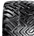
440/50 R17 All-Ground