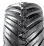
400/55-17.5 Terra Twin